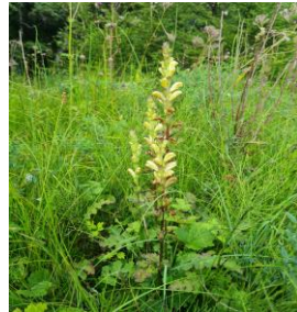
Kung Karls spira