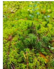
Björnmossa o vitmossa