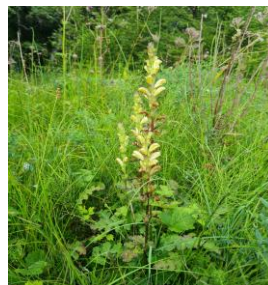
Kung Karls spira