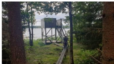
Tornet i Ruggebo

Samåkning från Bryggans parkering Kl. 7.30