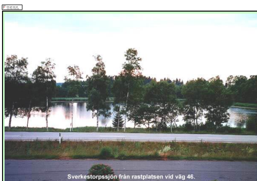
Sverkestorpssjön från rastplatsen vid väg 46.