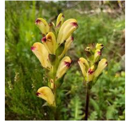
Kung Karls spira